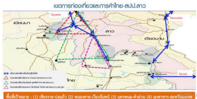
พื้นที่เป้าหมาย : (1) เชียงราย-บ่อแก้ว (2)หนองคาย-เวียงจันทน์ (3) นครพนม-คำม่วน (4) มุกดาหาร-สะหวันนะเขต