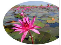
คลอง ( แห่ง )