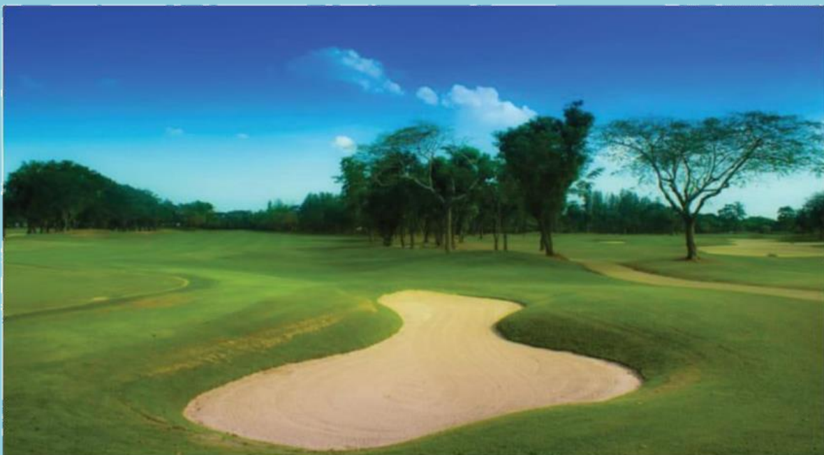
สนามกอล์ฟ จัดเป็นธุรกิจการกีฬา จึงได้รับการลดภาษี

1.4 ลดภาษีร้อยละ 90 ของจำนวนภาษีที่จะต้องเสียของทรัพย์สินที่ใช้เป็นสถานที่เล่นกีฬา สวนสัตว์ สวนสนุก หรือที่จอดรถสาธารณะ