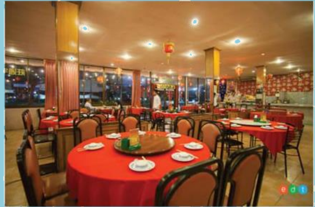
ภัตตาคาร