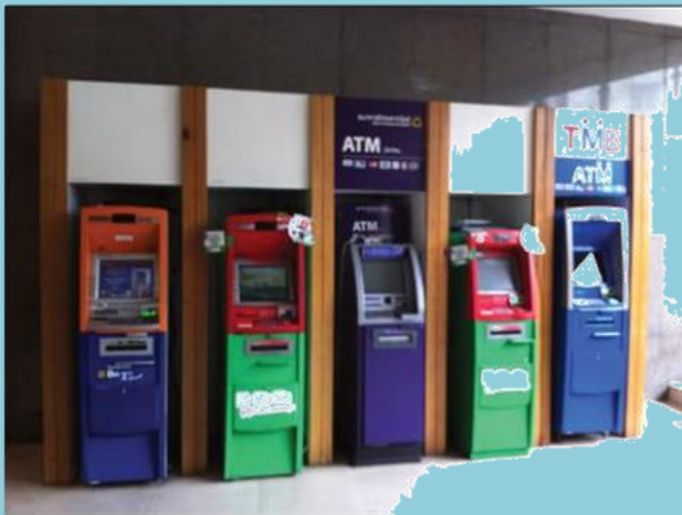
ตู้ฝากถอนเงินสด