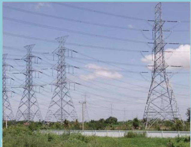
เสาไฟฟ้า