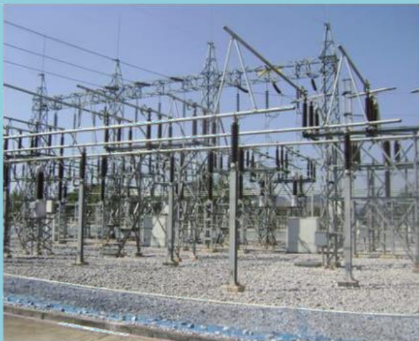
สถานไฟฟ้า