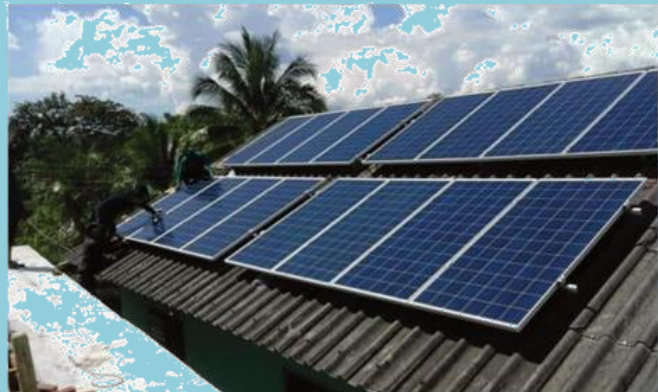
แผงโซลาเซลล์