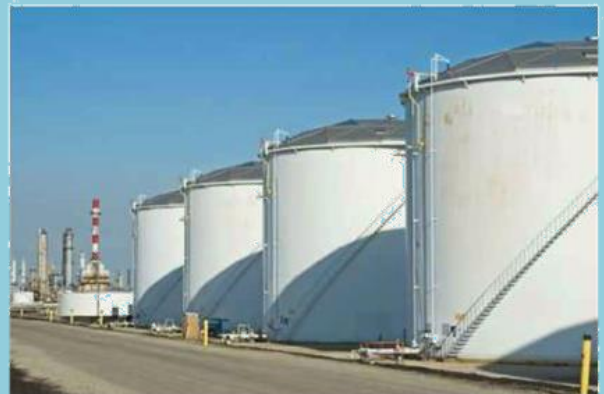
ถังเก็บน้ำมันบนดิน