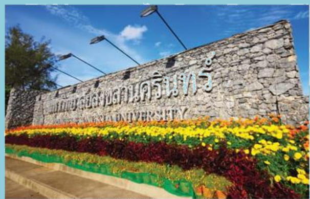
ตัวอย่างป้ายที่ไม่ต้องเสียภาษี