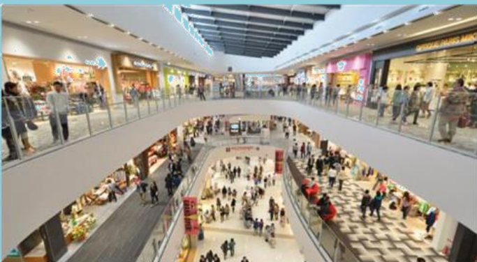
ห้างสรรพสินค้า