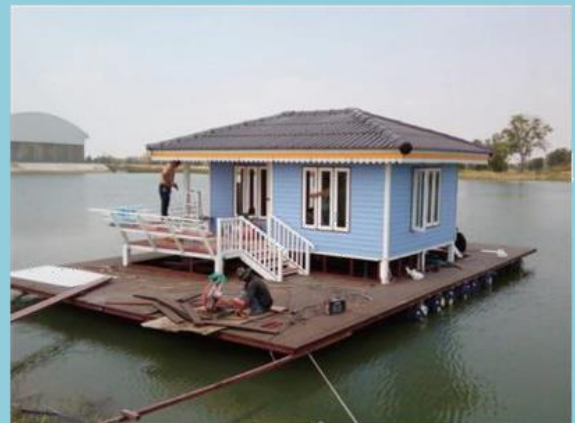
บ้านเรือนแพ