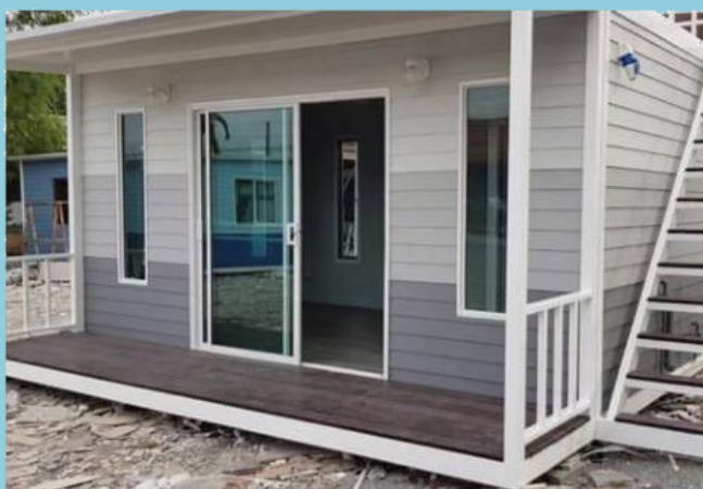
บ้านประกอบเสร็จ