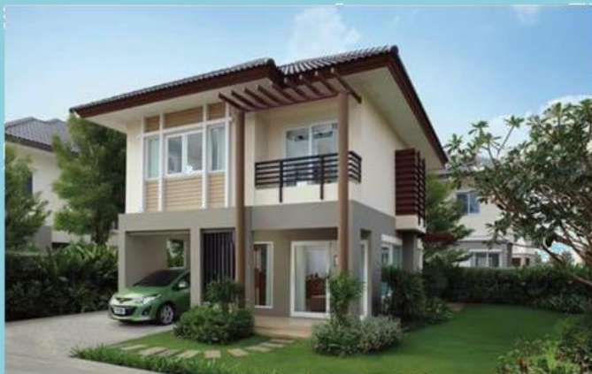
บ้านเดี่ยว