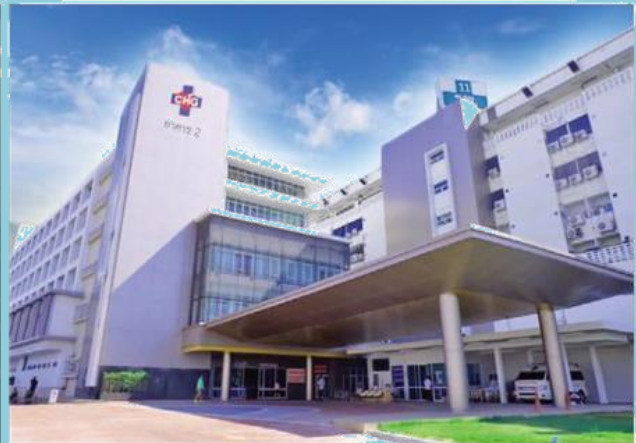
สถานพยาบาล