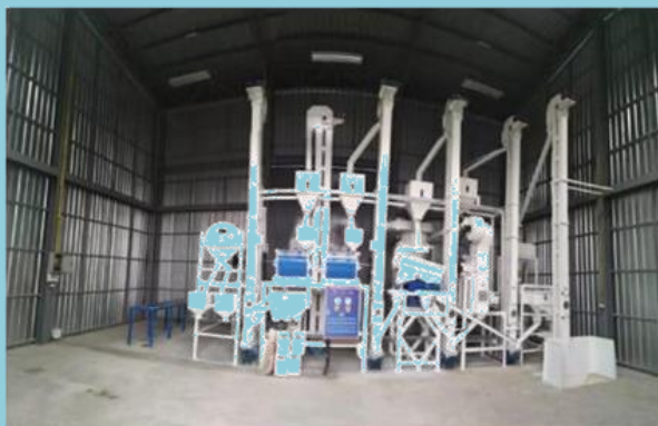
โรงสีข้าว