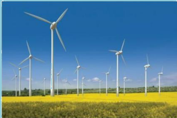
กังหันลม

ตัวอย่างสิ่งปลูกสร้างที่อยู่ในข่ายได้รับการยกเว้นภาษี