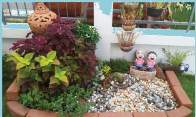
สวนหย่อม