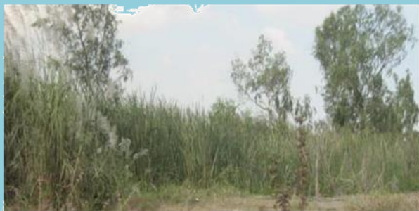
ที่ดินรกร้างไม่ได้ใช้ประโยชน์

(2) ที่ดินที่ไม่เป็นกรรมสิทธิ์ของบุคคลธรรมดาหรือนิติบุคคล แต่อยู่ในความครอบครองของบุคคลธรรมดาหรือนิติบุคคล เช่น สปก. 4, ก.ส.น., ส.ค.1, นค.1, นค.3 ส.ท.ก.1 ก, ส.ท.ก.2 ก, นส.2 (ใบจอง) และที่ดินอันเป็นทรัพย์สินของรัฐ ซึ่งมีการเข้าไปครอบครองหรือทำประโยชน์ ฯลฯ เป็นต้น