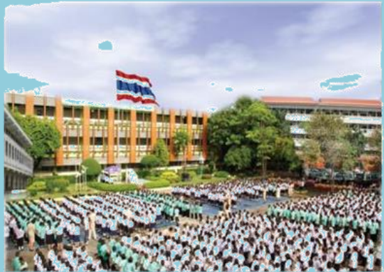
สถานศึกษา