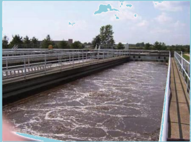
บ่อบำบัดน้ำเสีย