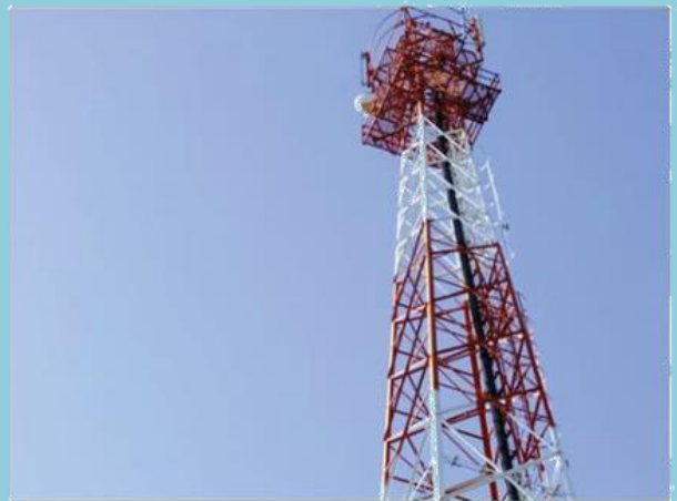
เสาส่งสัญญาณอินเทอร์เน็ต