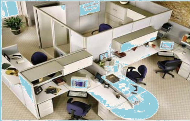
สำนักงาน