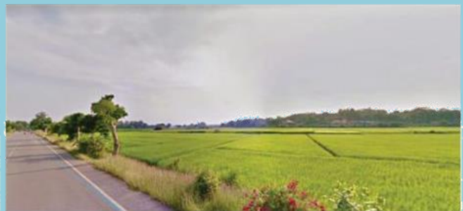
ที่ดินที่ใช้ทำกสิกรรม