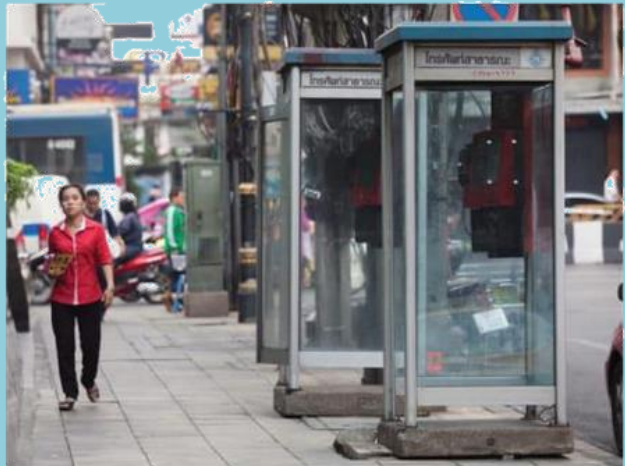
ตู้โทรศัพท์สาธารณะ