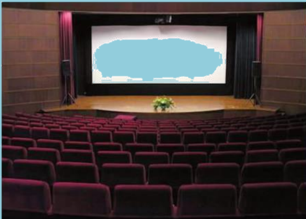
โรงมหรสพ