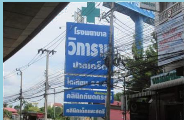
ตัวอย่างป้ายที่ต้องเสียภาษี

หากในกรณีที่ไม่มีผู้มายื่นแบบแสดงรายการภาษีป้าย หรือเจ้าหน้าที่ไม่สามารถติดต่อหรือหาตัวเจ้าของป้ายได้ ให้ถือว่าผู้ครอบครองป้ายมีหน้าที่เสียภาษีป้าย แต่ถ้าหาตัวผู้ครอบครองป้ายไม่ได้ เจ้าของหรือผู้ครอบครองที่ดินที่ติดตั้งป้ายจะต้องเป็นผู้เสียภาษีป้ายแทน ตามลำดับที่กล่าวมา