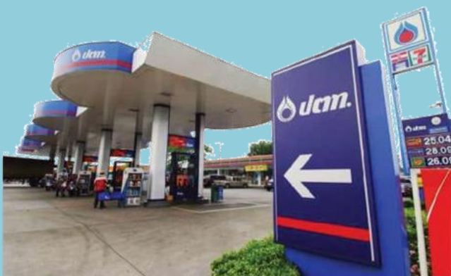
สถานีบริการน้ำมัน