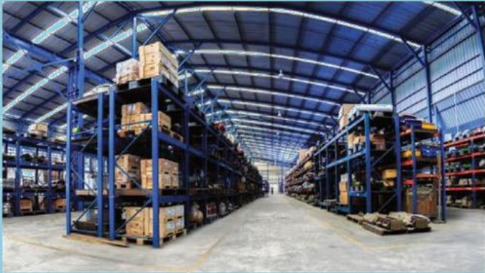
คลังสินค้า