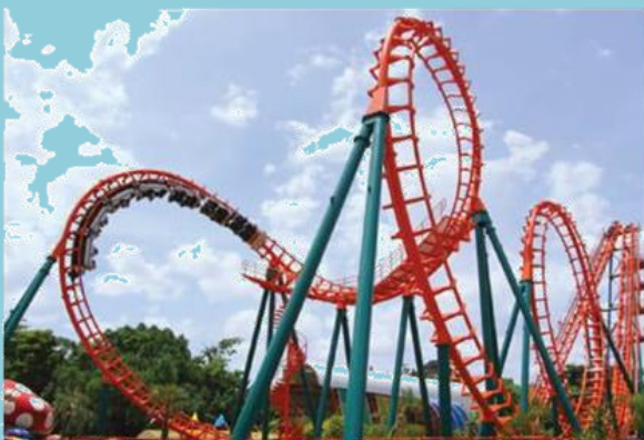
เครื่องเล่นในสวนสนุก